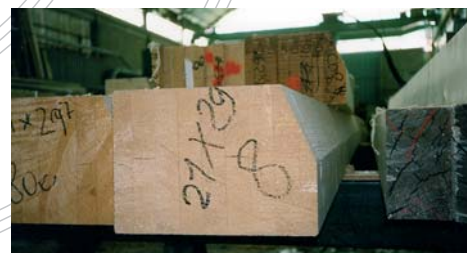
mit zusätzlicher Schwenkspindel