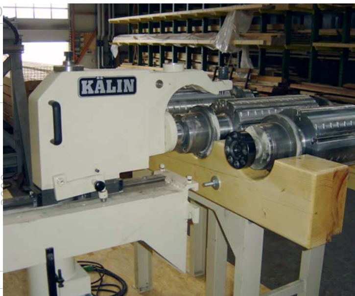
Depot für Hobelwellen