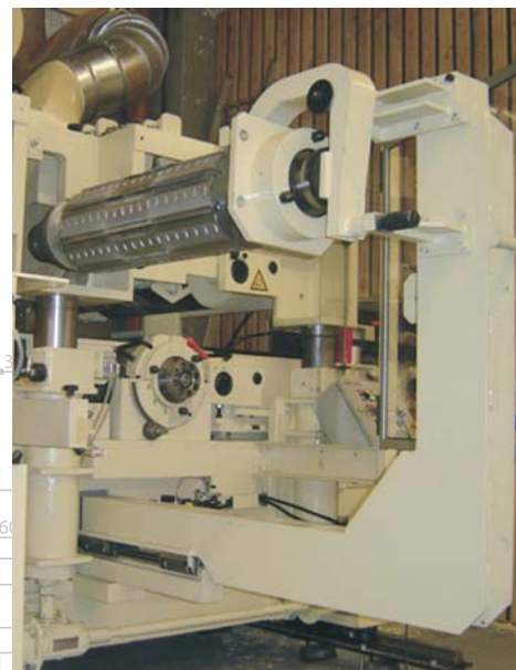
Eingebauter Servicearm zum Ein- und Ausbau der Hobelwellen