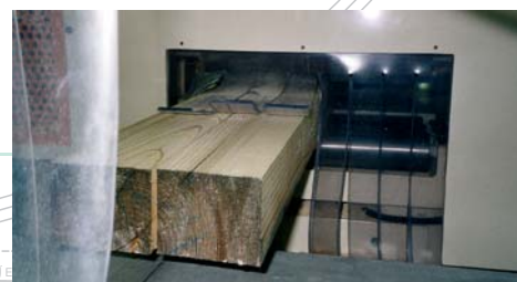
mit angebauter Trennsäge