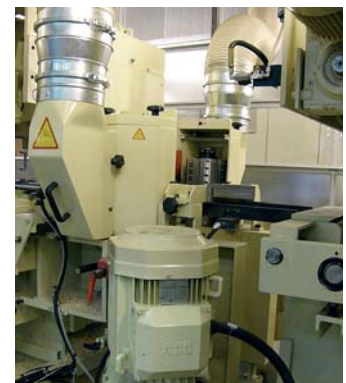
«Schwimmende» Vertikal-Einheiten, der Lamelle über die ganze Arbeitsbreite folgend