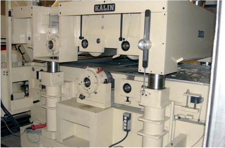
Hydraulisch oszillierende Horizontalwellen