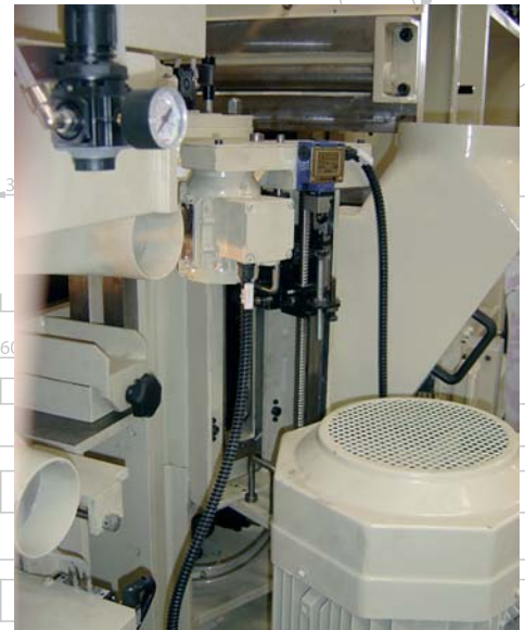
Automatische Jointeinrichtung auf den Vertikaleinheiten