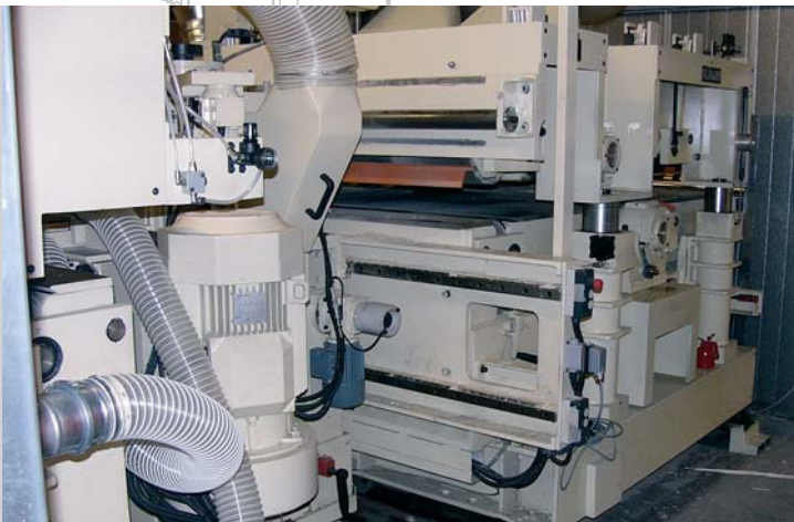
Grundmaschine auf Verstellbahn zur Ausnutzung der Hobelmesser über die ganze Breite (Vertikaleinheiten und Auszugsaggregat bleiben in Position)